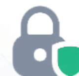
Chiffrement de bout en bout