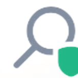
DATEV Hosting (ISO 27001)